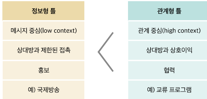
Zaharna, R. S. (2009). "Mapping Out a Spectrum of Public Diplomacy Initiatives: Information and Relational Communication Frameworks." In N. Snow & P. M. Taylor (Eds.), Routledge Handbook of Public Diplomacy (pp. 86-100). New York: Routledge.

그렇게 무언가를 함께 하다보면 그 과정에서 서로 관심을 물어보며 공감대를 형성하고 정이 들어 친구가 될 수 있습니다. 관계가 형성되는 것이지요. 그리고 그 관계를 유지하기 위해 계속 대화를 나누며 서로를 이해하는 방식으로 민간외교는 긍정적인 결과를 내게 됩니다. 즉 민간외교란 상호 이해를 증진하는 일련의 과정인 것입니다.